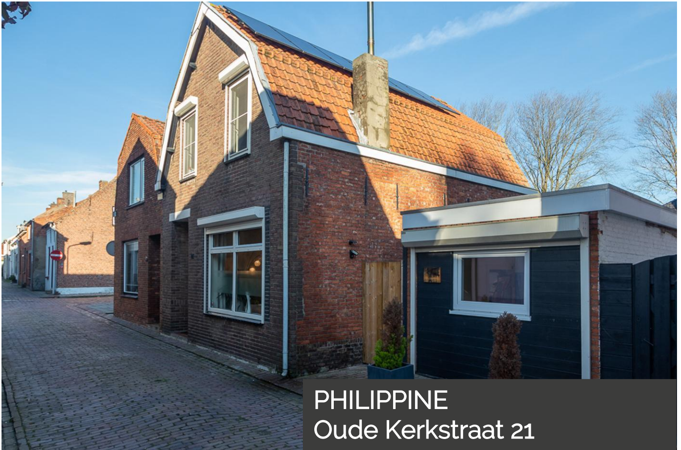
PHILIPPINE Oude Kerkstraat 21